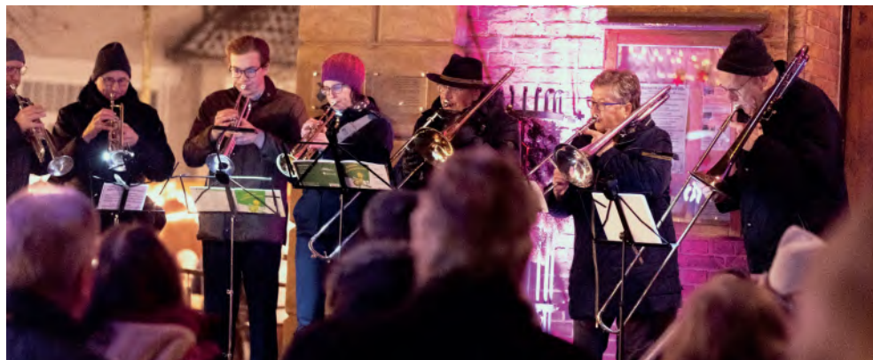
Die Bläserinnen und Bläser des Posaunenchores haben vor der Kirche adventliche Freude verbreitet.